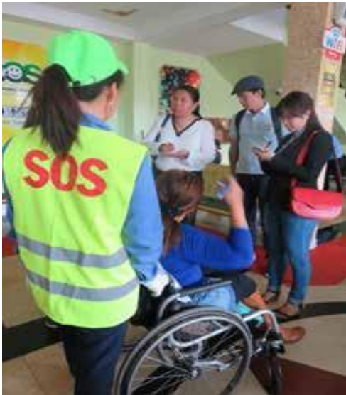
УБ төмөр замын буудал “SOS үйлчилгээ”

SOS үйлчилгээ нэвтрүүлэн хөгжлийн бэрхшээлтэй иргэдийн сэтгэл ханамжийг дээшлүүлэх, нэмэлт үйлчилгээг нэвтрүүлж, хөгжлийн бэрхшээлтэй иргэдэд үйлчлэх зам, үйлчилгээний цонхыг нээн ажиллуулж байна.