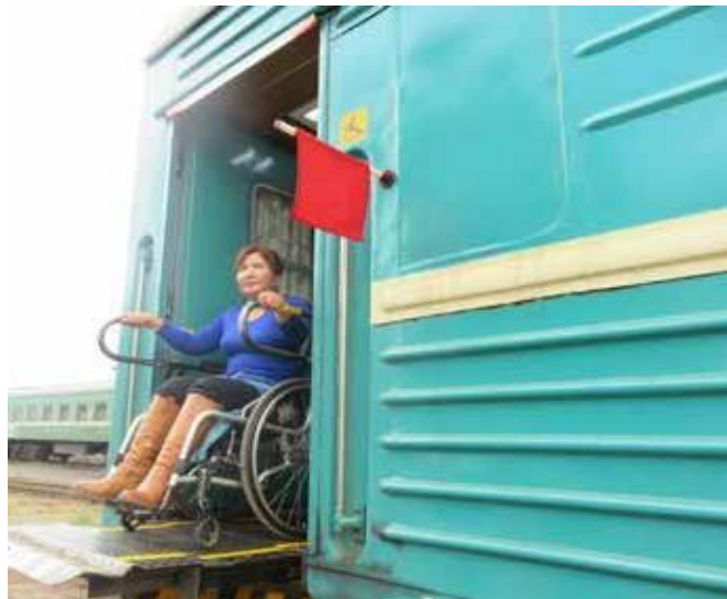
Хүртээмжтэй болгосон галт тэрэ