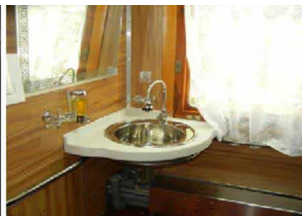
482-р вагонд хөгжлийн бэрхшээлтэй зорчигчдыг суулгах шат, ариун цэврийн өрөө