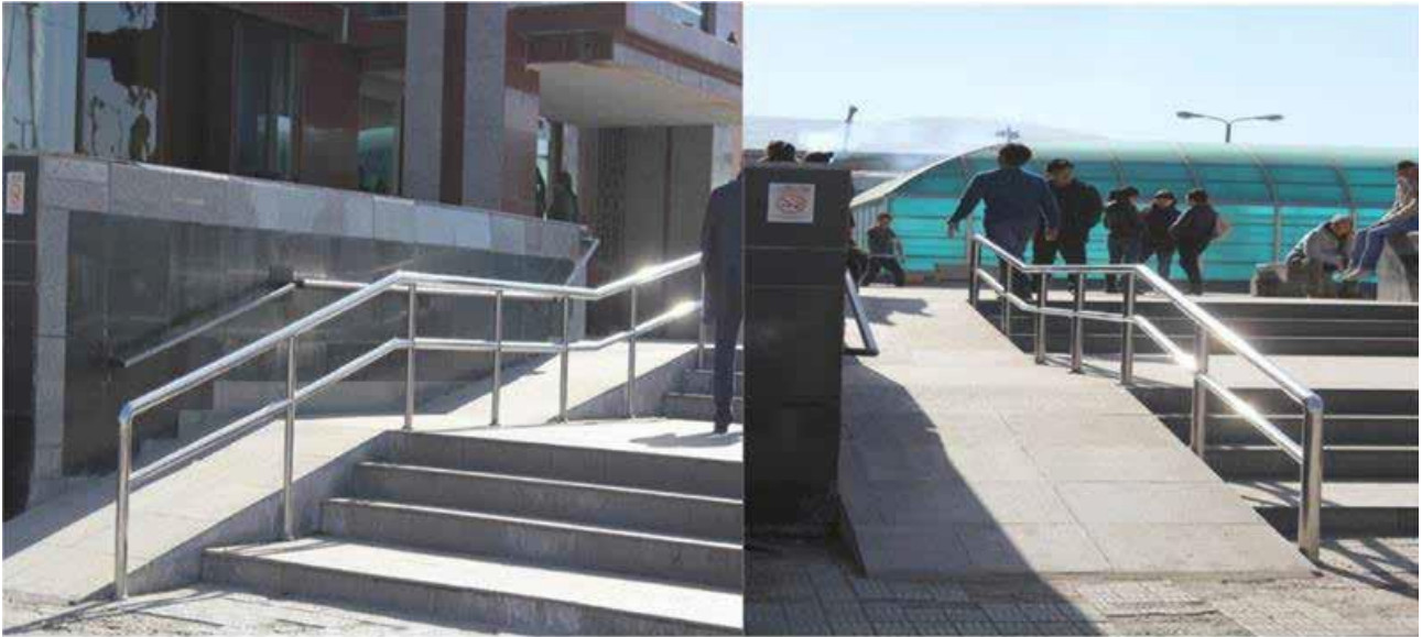
Хөгжлийн бэрхшээлтэй иргэд тэргэнцэртэй зорчих тавцан

SOS үйлчилгээ нэвтрүүлэн хөгжлийн бэрхшээлтэй иргэдийн сэтгэл ханамжийг дээшлүүлэх, нэмэлт үйлчилгээг нэвтрүүлж, хөгжлийн бэрхшээлтэй иргэдэд үйлчлэх зам, үйлчилгээний цонхыг нээн ажиллуулж байна.