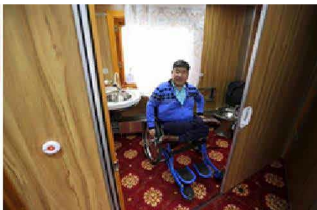
482-р вагоны дотоод тоноглол